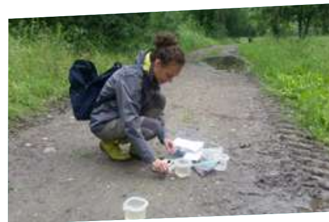
Analyse physico-chimique des mares

En parallèle, une évaluation de l'état de conservation des berges fréquentées en période estivale a été dressée, tandis qu'un suivi a été lancé sur les hauteurs, fréquences et périodes d'inondation des annexes hydrauliques de l'Ariège et de la Garonne. Plus de 100 relevés de paramètres physico-chimiques sur une douzaine de points d'eau ont été réalisés de manière à identifier d'éventuelles pollutions et de caractériser leur état physique et chimique.