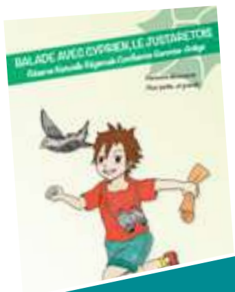
Sentier de Pins-Justaret avec livret pédagogique