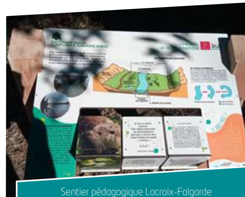
Sentier pédagogique Lacroix-Falgarde