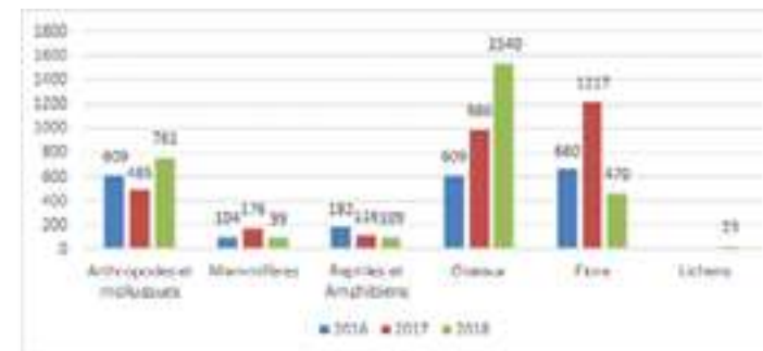
Nombre de données naturalistes collectées par le gestionnaire de la Réserve naturelle

« 3 034 données naturalistes en 2017 et 3 002 en 2018, tant pour la faune que pour la flore.