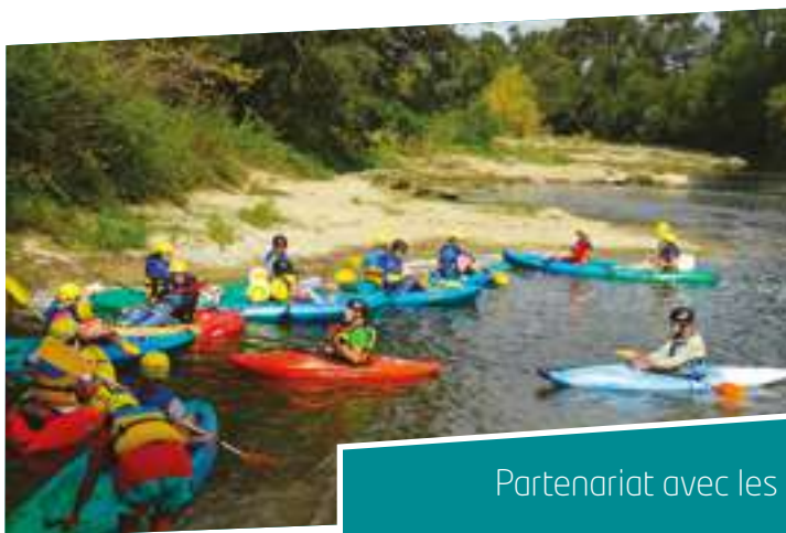
Partenariat avec les clubs de kayak

« 11 classes du premier et second degré, soit 309 élèves, mais également des étudiants d'université ou autres (Master, BTS, BPJEPS...), soit 44 personnes supplémentaires, ont bénéficié d'animations pédagogiques et ont été accueillis sur la Réserve naturelle au cours de l'année 2018.