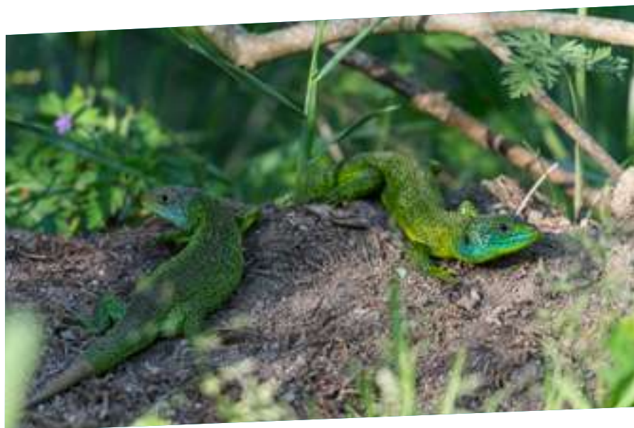
Lézards verts