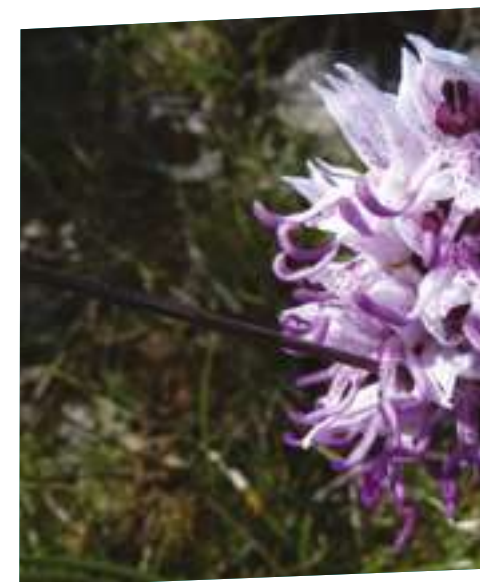
Orchis singe