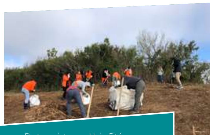
Partenariat avec Unis Cité

« 12 sorties ont ainsi été assurées en 2018 et ont touché plus de 274 personnes.