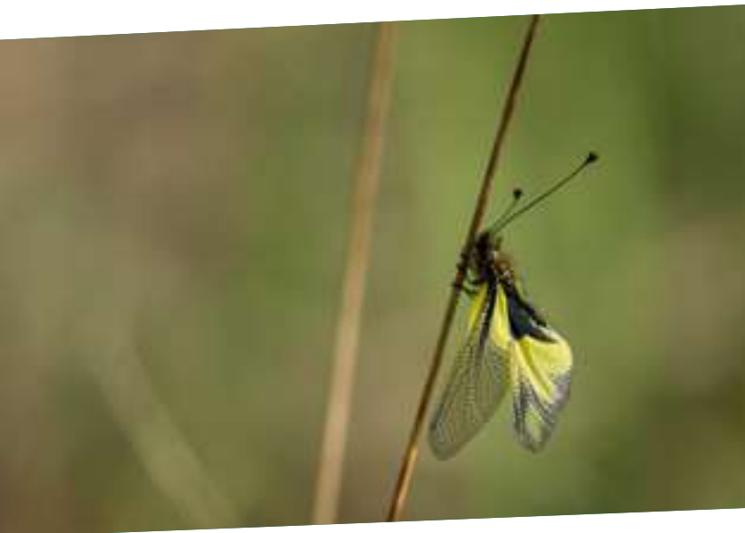
Ascalaphe soufré

+ de 600 espèces animales et 700 espèces végétales sont ainsi recensées sur le territoire de la Confluence Garonne-Ariège