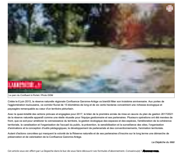
Le Confluent : une réserve naturelle aux portes de Toulouse Créée le 8 juin 2015, la réserve naturelle régionale Confluence Garonne-Ariège va bientôt fêter son troisième anniversaire. Aux portes de l'agglomération toulousaine, le centre fluvial de 11 kilomètres de long et de six cents hectares concentre une richesse écologique et paysagère remarquable au cœur d'un territoire périurbain.

Actualité > Grand Sud > Haute Garonne > Ramonville-Saint-Agne Publié le 04/01/2018 à 08:28