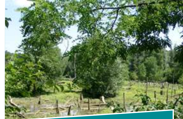
Exemples de zones inondables

Selon les résultats des études en question, l'équipe gestionnaire de la Réserve orientera ou non la gestion de certains sites vers une restauration de leur inondabilité « naturelle ».