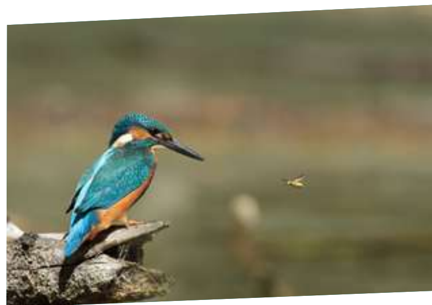
Martin pêcheur