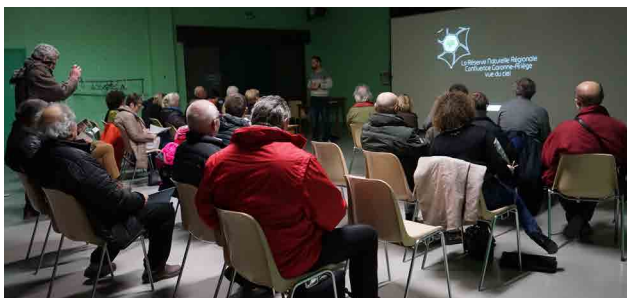
Conférence sur les paysages de la Réserve naturelle

Le 1er février dernier, dans le cadre de l'animation de l'Observatoire photographique des paysages fluviaux, Nature Midi-Pyrénées a organisé sur la commune de Clermont-le-Fort, une conférence sur les paysages de la Réserve Naturelle. Chaque habitant étant témoin de l'évolution de ces paysages sculptés par la Garonne, l'Ariège et l'Homme au fil du temps, ces