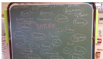
Brainstorming autour du mot « Nature »

Le 27 mars dernier, Nature Midi-Pyrénées participait à une réunion des acteurs de l'Éducation au Développement Durable au rectorat de Toulouse afin de présenter les actions de sensibilisation menées par Nature Midi-Pyrénées. Les animations conduites sur la RNR ont été présentées avec en perspective pour les élèves du territoire de bénéficier d'un programme d'animations mutualisé avec les partenaires du territoire ! Une réunion est en cours de programmation en ce sens.