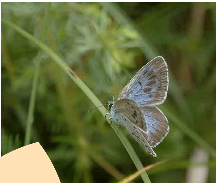
L'Azuré du serpolet

L'Azuré du Serpolet ( Maculinea arion ) est un beau et grand papillon bleu, avec d'imposantes tâches noires sur les ailes antérieures. Ce lépidoptère aime visiter de nombreuses fleurs, à dominante violette ou bleue, mais ce sont surtout les thym et l'Origan ( Origanum vulgare ), plantes hôtes de ses larves, qui l'attirent plus particulièrement. De la famille des maculinea, la chenille de ce papillon a la particularité de passer l'hiver dans une fourmilière !