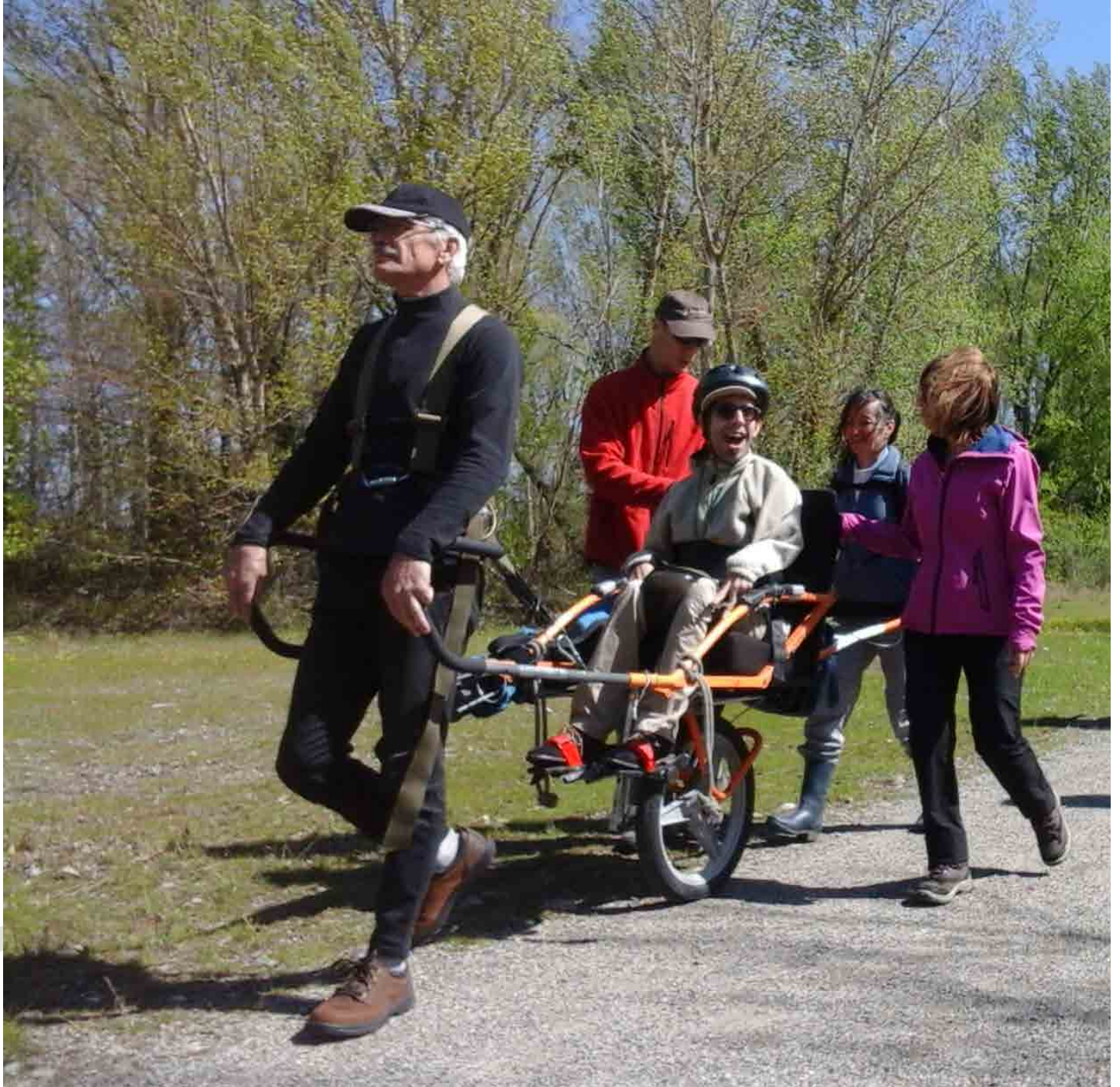
La « Joëlette » de l'UMEN sur les sentiers de la RNR