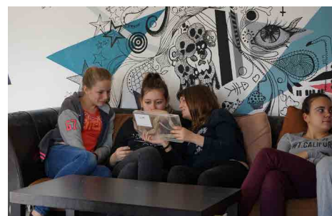
Echanges autour des paysages et des espèces présentes sur la RNR avec le CIJ de Pinsaguel