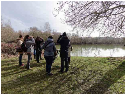
Observation des oiseaux du Parc du Confluent

A l'occasion des Journées Mondiales des Zones Humides en février/mars, Nature Midi-Pyrénées a initié 3 actions sur le territoire de la réserve.