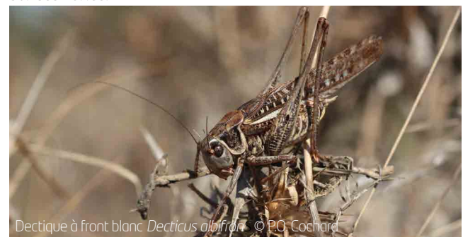
Dectique à front blanc Decticus albifrons

Ainsi, sur les parties sablonneuses écorchées des terrasses alluviales, où souvent ne poussent quasi aucunes plantes, des gros criquets aux ailes colorées s'envolent devant nos pas : ailes rouges pour le Criquet de Barbarie Calliptamus barbarus , bleues avec une bande noire pour l'oedipode turquoise Oedipoda caerulescens ou bleues azur sans noir pour l'Oedipode aigue-marine Sphingonotus caeruleans . Ces criquets silencieux (ces espèces colorées ne strident pas) semblent régner en maître sur ces zones.