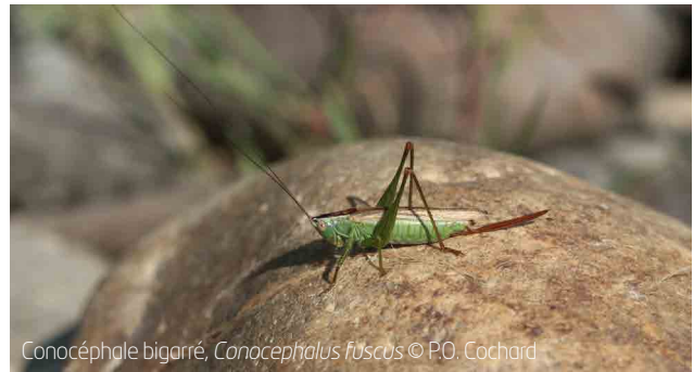
Conocéphale bigarré, Conocephalus fuscus

Dans toutes les zones semi-boisées, les lisières, se rencontre un cortège typé de peu d'espèces mais quasi constantes. Deux sauterelles vivent perchées dans les buissons, arbres et arbustes : le Phanéoptère méridional Phaneroptera nana (abondant sur les arbustes), le Méconème méridional Meconema meridionale (qui a une préférence nette pour vivre dans les chênes). Si ces deux espèces sont inaudibles, l'ambiance sonore est toutefois assurée en provenance de la couche de litière de feuilles, par le Grillon des bois Nemobius sylvestris (souvent abondant et peut striduler toute l'année, y compris au soleil d'hiver).