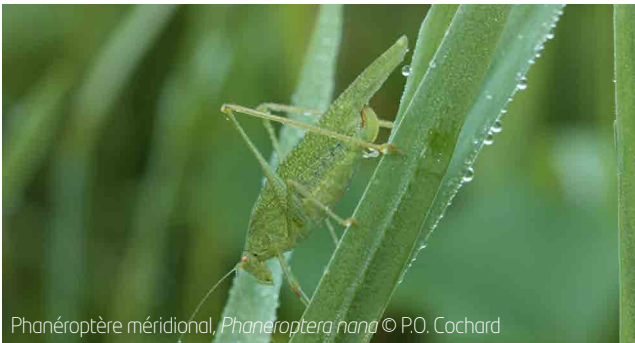
Phanéoptère méridional, Phaneroptera nana