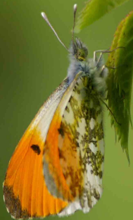
L'Aurore, Anthocharis cardamines