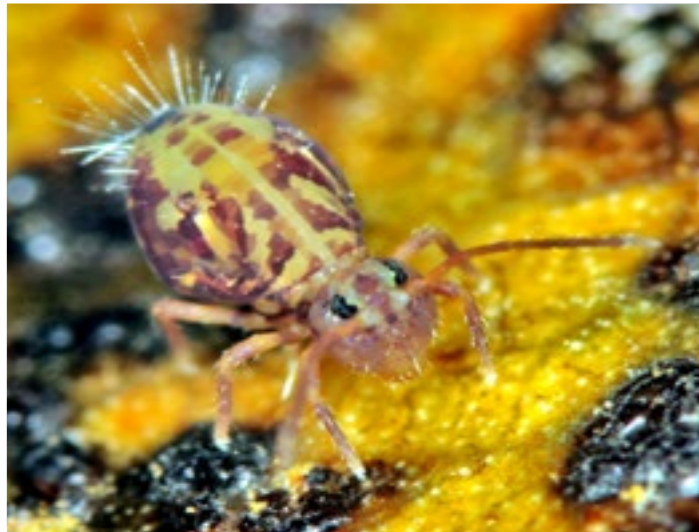
Dicyrtomina ornata , vraie palette de couleurs - Symphypleone

Ils sont partout et pourtant ils sont méconnus. Ils vivent au sol et même sur l'eau en bordure des étangs, en haute montagne, dans les déserts, les grottes ou sous des latitudes polaires. On en connaît plus de 8000 espèces et il en reste probablement davantage à découvrir. En forêt, sous l'empreinte d'un seul pas, ils sont parfois plusieurs centaines à évoluer entre la surface et quelques centimètres de profondeur.